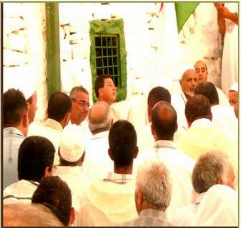
Visite du mausolee de Moulay Abdessalam Ibn Machich. Juillet 2007