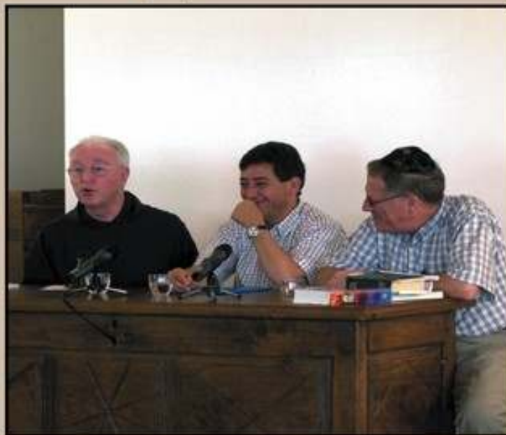
Encuentro Inter. Religioso en Magdala

El Cheikh Khaled Bentounes es el guía espiritual de la 'Tarika Alawiya'. Es el presidente fundador de varias asociaciones basadas en Europa y en el Maghreb, entre ellas: