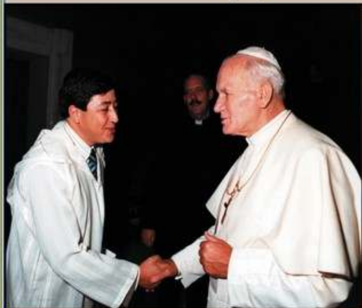
Encuentro en el Vaticano con el Papa Juan-Pablo II en 1989